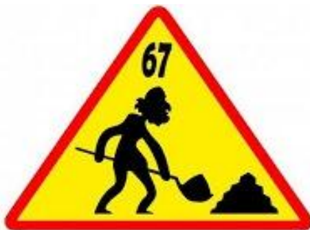
Kontuz, adinekoa lanean!